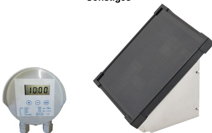
Schaltuhr und Solarmodul